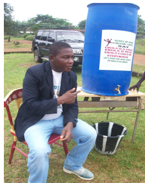
Water en zeep doodt het Ebola virus

om deze crisis te bestrijden. Veelvuldig handen wassen en ontsmetten met zeep helpt om overdracht van het virus tegen te gaan. Ze startte daarom een preventie programma.