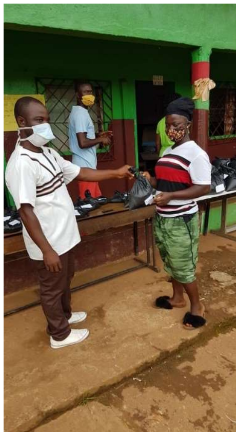
4 mei 2020 voedselbedeling Rock Hill Community in Liberia.