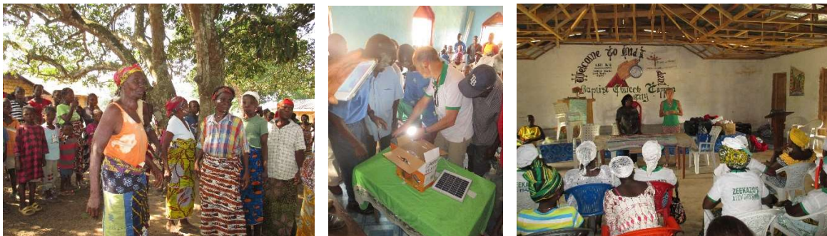
Foto1 -traditionele vroedvrouwen in Zahn Zeeye foto2 – gift solarlicht met 4 lampen foto3 – workshop voor traditionele vroedvrouwen

Zahn Zeeye – dorp diep in de Liberiaanse Jungle van Nimba County waar we een verbond mee sluiten om hulp te bieden in deze regio.