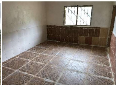
foto 15 bevallingsruimte