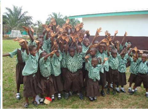
foto enthousiaste kinderen op Acres of Hope School

Dit schooljaar startte ook in Liberia anders door de corona pandemie. De school ging open op 4 januari 2021 en het schooljaar loopt tot eind juli 2021. Door ons aller inspanning en de sponsoring die we vanuit België samenbrachten konden alle 300 kinderen van Rock Hill terug naar school komen.