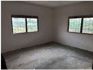
Foto16 één van de kamers