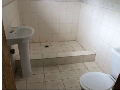
foto17 badkamer aan de bevallingsruimte