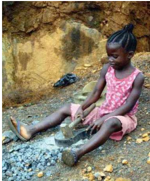
Foto's stenen kappen in de steengroeve ook kinderen helpen mee

De school in Rock Hill werd gebouwd door Acres of Hope Belgium tussen 2010 en 2012 voor de kansarme kinderen van Rock Hill Community die zonder onze tussenkomst werken in de steengroeve. Families leven er van minder dan 1 euro per dag en kappen rotsen tot steenslag om te overleven. Kinderen vaak niet ouder dan 5 jaar moeten reeds meehelpen aan deze zware arbeid. Voor deze kinderen bouwden we de school en ondertussen ondersteunen we meer dan 300 kinderen met het schoolgeld. Door deze ondersteuning is de ouderbijdrage klein en kan er toch goed onderwijs gegeven worden.