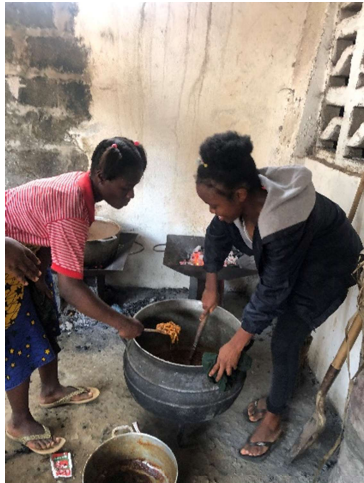
Vorbereiding van de sportdag op school