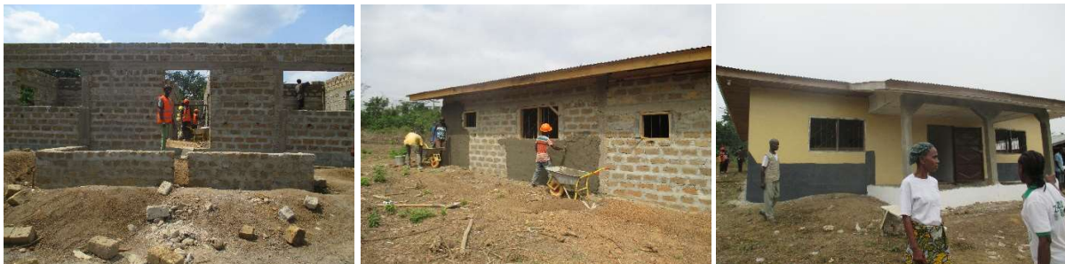
Foto 10,11 en 12 bouw van Zahn Zeeye Clinic

In December 2018 is Acres of Hope dan begonnen met de bouw van een Clinic in Zahn Zeeye. Ongeveer 9000 mensen wonen rond dit centraal dorp in de regio. Vroeger, voor de burgeroorlog, had dit dorp reeds een erkende Clinic. Deze is echter door de rebellen in brand gestoken en tot op de grond afgebrand.