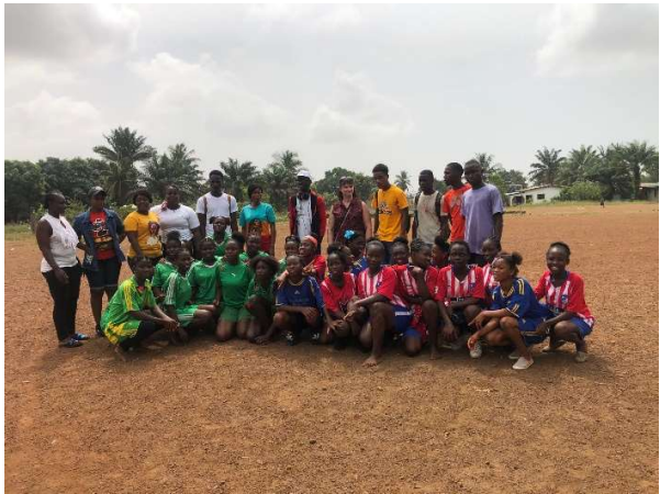
Vormen van de verschillende teams – leerkrachten tegen ouders – oud leerlingen tegen nieuwe leerlingen