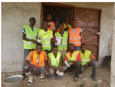
Foto 13 het bouwteam