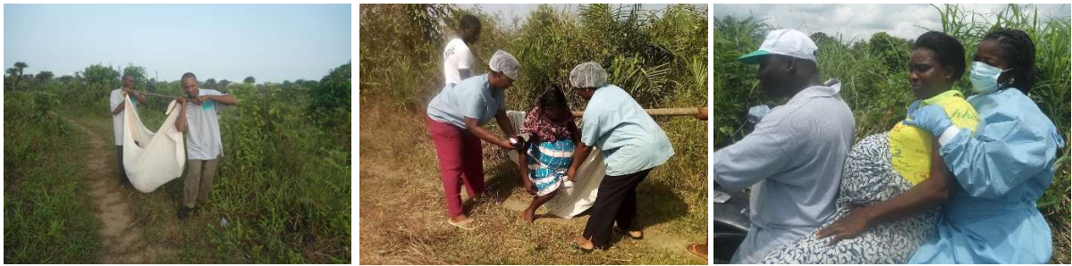
foto 7,8 en 9 transport vanuit Zahn Zeeye naar Tappita Hospital op 25 km

Voor deze mensen besloot Acres of Hope Belgium te zoeken naar hulp. We begonnen met het steunen van een mobiel team van vroedvrouwen, die de verschillende dorpjes bezochten. We zorgden voor enkele bromfietsen om hun verplaatsingen vlotter te maken en zwangere vrouwen tijdig naar het ziekenhuis te vervoeren. Ook werd een workshop gegeven rond hygiëne en veilige bevalling aan traditionele vroedvrouwen uit de regio. Er werd een opleiding gegeven om risico-zwangerschappen te herkennen en zodoende vlugger door te verwijzen naar het ziekenhuis van Tappita.