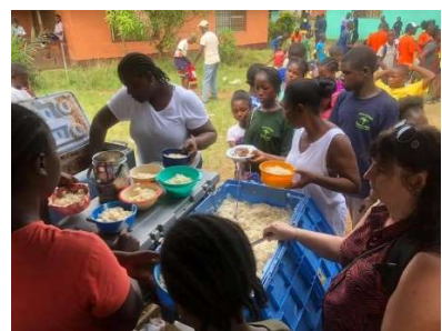
En na een intensieve sportdag – eten voor iedereen: rijst – bonen – kip