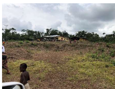
foto 14 Zahn Zeeye Clinic