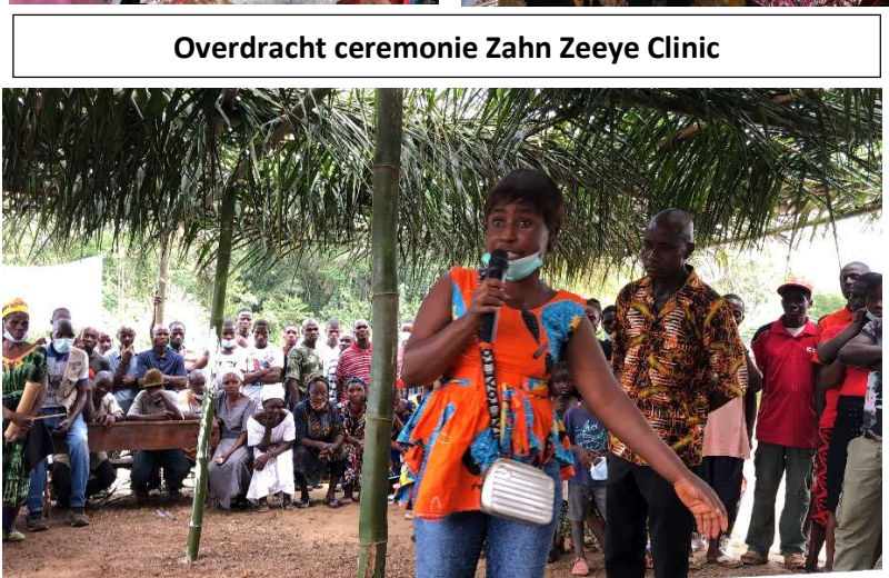
Overdracht ceremonie Zahn Zeeye Clinic