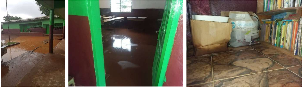
Foto's hevige regens zorgen voor wateroverlast op school – ook hier is de klimaatwijziging voelbaar, het regenseizoen begint steeds vroeger

Andere activiteiten tijdens dit projectbezoek waren: