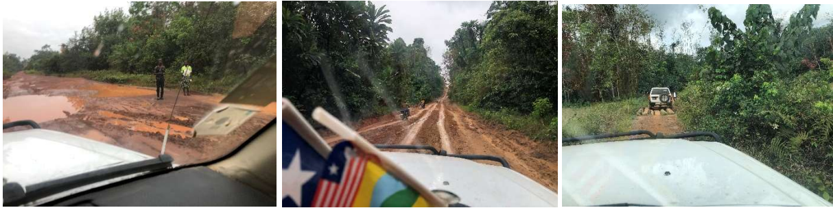
Foto 4,5 en 6 van Ganta tot aan het project in Zahn Zeeye 125 km over aardewegen (droog seizoen) niet bereikbaar in regenseizoen

Voor deze mensen besloot Acres of Hope Belgium te zoeken naar hulp. We begonnen met het steunen van een mobiel team van vroedvrouwen, die de verschillende dorpjes bezochten. We zorgden voor enkele bromfietsen om hun verplaatsingen vlotter te maken en zwangere vrouwen tijdig naar het ziekenhuis te vervoeren. Ook werd een workshop gegeven rond hygiëne en veilige bevalling aan traditionele vroedvrouwen uit de regio. Er werd een opleiding gegeven om risico-zwangerschappen te herkennen en zodoende vlugger door te verwijzen naar het ziekenhuis van Tappita.